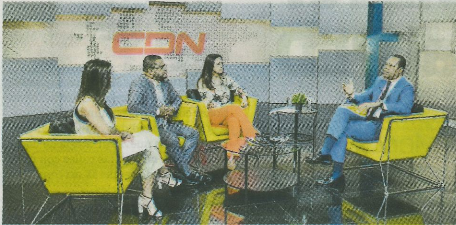
Eddy Alcántara participó en la entrevista de Despierta con CDN.

CONSUMO. El director del Instituto Nacional de Protección de los Derechos del Consumidor (Pro Consumidor), informó que hasta la fecha han cerrado 27 comercios que cometieron fraudes con tarjetas de los programas sociales del Gobierno.