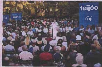
Alberto Núñez Feijóo, del PP, en un acto en Barcelona.

Ambos partidos, liderados respectivamente por la vicepresidenta segunda del actual Ejecutivo, Yolanda Díaz, y Santiago Abascal, podrían ser claves para la formación del Gobierno que saldrá de las urnas el próximo domingo, siempre y cuando ni el conservador Partido Popular (PP), encabezado por Alberto Nú-