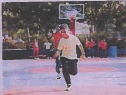
Varios de los niños participantes dan riendas sueltas a su deseo de divertirse en las canchas de tenis del complejo.

Los niños disfrutarán de clases de tenis, baloncesto,