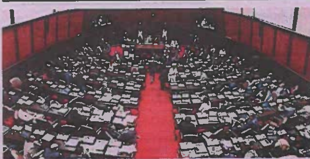
Votación en el Congreso Nacional.