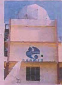
Meteorología dio informe.

También sobre Samaná, La Altagracia, El Seibo, Hayo Mayor, Monte Plata, San