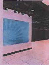
Centro de datos.

Se sitúa como la única entidad bancaria del sistema financiero nacional en contar con ambos centros de datos certificados