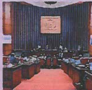
Senadores sesionaron ayer. P.E.

pueden citar la reducción de costo de los fletes marítimos y aéreos, la reducción de los costos de inventarios, y el aumento de la cantidad y diversidad de bienes e insumos disponibles para el mercado internacional y local. Además, el proyecto establece la posibilidad de un mejor escenario para el abastecimiento oportuno, en beneficio del sector industrial, comercial y del consumidor en general, porque genera un incremento con la frecuencia del uso de los medios de transporte de las mercancías. ■ elCaribe