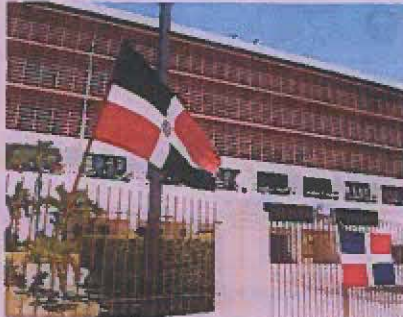
Parte frontal del Senado.