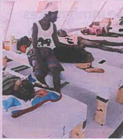
Pacientes en un hospital de MSF en Haití.

En la última semana se registraron decenas de secuestros, entre ellos de estudiantes, padres de alumnos e incluso de personas que se encontraban en sus propias casas. Este deterioro de la situación se produce después de meses marcados por un recrudecimiento de la crisis socioeconómica y política en Haití, una espiral de violencia y la reaparición del cólera, que ya ha causado cerca de 600 muertos en el país desde octubre pasado.