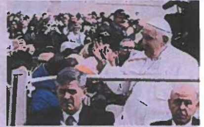
El papa Francisco saluda feligreses.

Francisco conmemoró el Día Internacional de las Mujeres, agradeciendo "su compromiso en la construcción de una sociedad más humana, a través de su capacidad de captar la realidad con una mirada creativa y un corazón tierno". Las mujeres llevan a cabo la mayor parte de la labor de la Iglesia en escuelas,