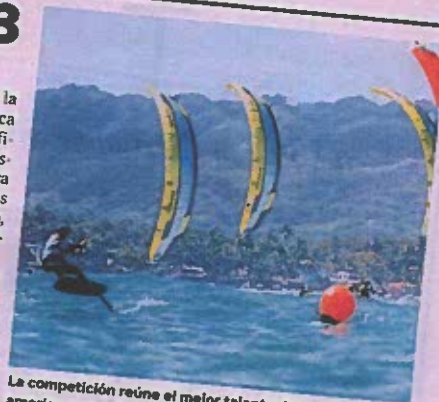
La competición reúne el mejor talento del continente americano con 17 países y 30 atletas.

Desde las 11:00 am de este jueves 9 de marzo hasta el próximo domingo 12, un evento para toda la familia, que podrá disfrutarse desde la playa del hotel Villa Taina.