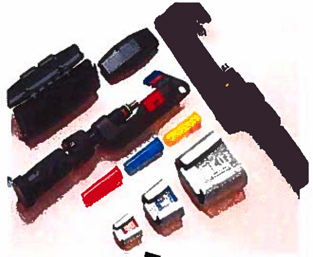
KIT de Conectores de cuña

Con la adquisición de dicha herramienta conseguimos mantener la disponibilidad de este recurso necesario para los trabajos de intervención de las subestaciones y los trabajos en nuestras redes eléctricas con cables URD de gran diámetro y difícil manejo.